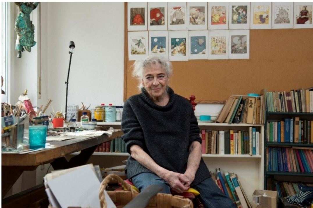
(1) Helga Gebert

»Und dann male ich und beim Malen verändert es sich. Beim Malen wollen dann die Figuren anders herum. Eigentlich habe ich gedacht, so soll es aussehen und dann kommt es plötzlich anders.«